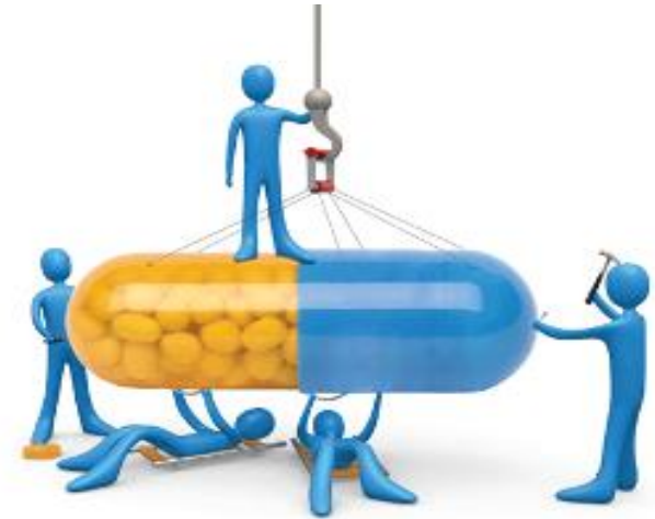
Kapszulába zárt kollektív tudás