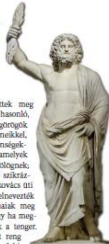
▲ Zeusz, a főisten

sélt mítoszokban születtek meg és lettek az emberhez hasonló, antropomorf lények. A görögök úgy élnek együtt az isteneikkel, ahogy a természeti jelenségekkel. Láttak hegyeket, amelyek szikrákat szórnak és füstölögnek; azt mondták, hogy azért szikráznak, mert odabenn egy kovács űti az izzó vasat. A kovácsot elnevezték Héphaisztosznak, a rómaiak meg Vulcanusnak. Látták, hogy a megrendül a föld, hullámozik a tenger. Azt mondták erre, azért reng a föld, mert a tengerben valaki rázza: elnevezték ezt a valakit Földrázóznak, Poszeidónnak, a rómaiak meg Neptunusnak. És ahogy ezek a történetek egyre gazdagodtak, összetalálkoztak, kialakult a mitológia. Ebben az egyre növekvő, burjánzó mesében, a mitológiában él és elevenedik meg a görög többistenhit.