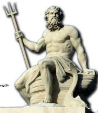
► Poszeidón, a tengernek istene

„Mindig a közepre tarts, nehogy, ha alant repülsz, a tenger habja neheztse el tollaidat, ha pedig magasabban, a tűz égessen össze! A közepen haladj, nem kell a csillagokat sem vizsgálnod, hogy tájékozódj, elég, ha engemet követsz!”