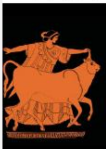
▲ Európa elrablása

„Olyan országot szeretnék, ahol még mesélnek az emberek”, így sóhaj Mikszáth Kálmán egyik öreg szereplője. Úgy tűnik, a klasszikus görögök világa ilyen volt. Rájötték, hogy az életet a szerelem mozgatja.