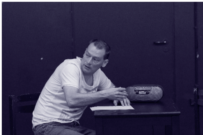
Üres lap 1.

Az elmélet és a gyakorlat összhangja az élet minden területén elvárt. Olyan ágazatokban, mint a köznevelés, szinte kötelező. Intézményi szinten mi erre törekszünk. Meg vagyok győződve arról, hogy a feladatot eredményesen meg tudjuk oldani, és diákjainkat a tőlünk telhető legjobb és leghatékonyabb nevelés-oktatással juttatjuk el reális céljaikhoz. Mindehhez adott egy komótosan úszó Noé bárkája.