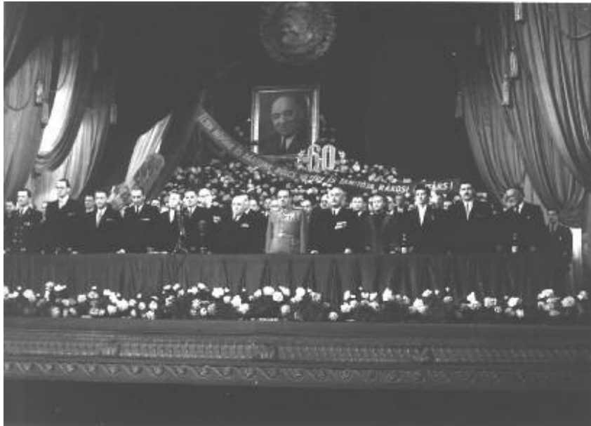
Ünnepség Rákosi Mátyás 60. születésnapján az Operaházban 6

Idézet a korszakból: „A nép és a párt egy, a párt és a vezér egy, a vezér és a nép egy.”