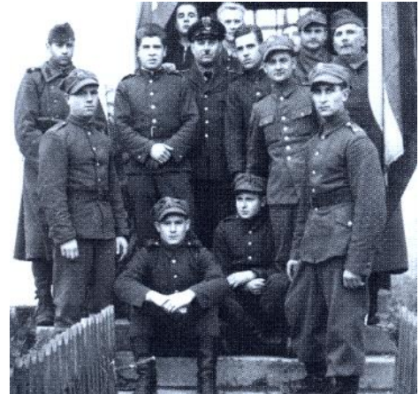
Magyarországra menekült lengyel katonák

2. § A honvédelmi kötelezettség magában foglalja a leventekötelezettséget (Második Rész), a hadkötelezettséget (Harmadik Rész), a honvédelmi szolgáltatások kötelezettségét (Negyedik Rész) és a légvédelmi kötelezettséget (Ötödik Rész).