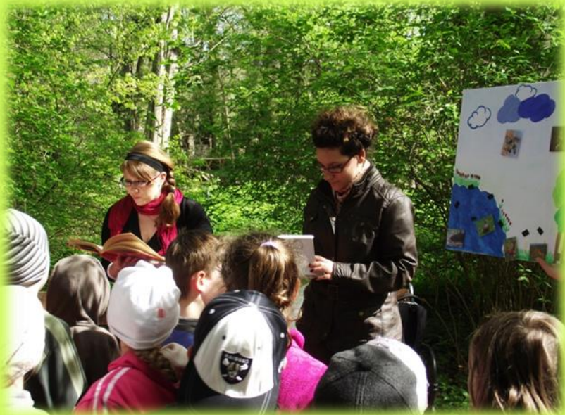
„Zöld Óvoda, Ökoiskola Programok kiszélesítése” projekt III. Országos Találkozója - Salgótarján, 2016.04.16.