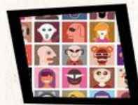
Feelings + greetings + személyes névmások